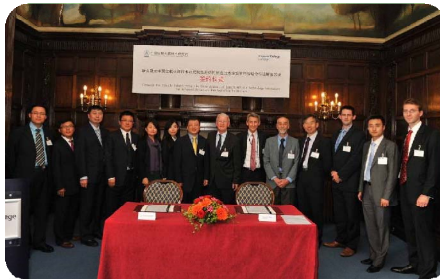
中英先进控制技术联合实验室