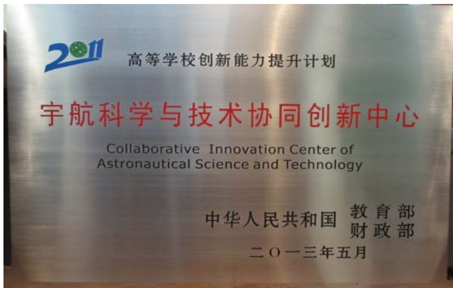
宇航科学与技术协同创新中心