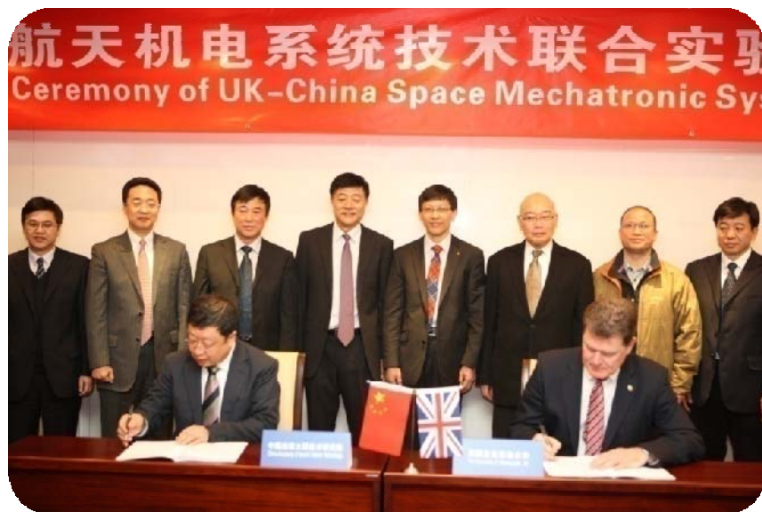
中英航天机电系统技术联合实验室