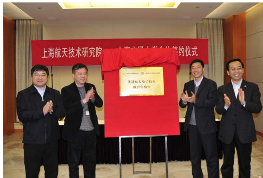
先进航天电子技术联合实验室